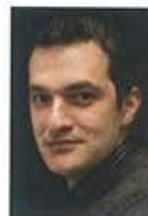
Piše: Milorad Čilić

Da nova vinarija zauzme željeno mesto u mnoštvu vina na tržištu, a da vina budu prepoznata kao drugačija i interesantnija, potrebni su entuzijazam, veliki rad i nesporan kvalitet. Sa idejom da makedonskim vinima osiguraju zasluženu prepoznatljivost na vinskoj mapi sveta, u Kamniku stvaraju moderna, zrela vina raskošne arome i ubedljive ekstraktivnosti, čime na pravi način oslikavaju snagu podneblja, blagonaklonost klimata i raznovrsnost vinogradarskih terena. Za vinariju Chateau Kamnik iz Skoplja može se reći da je kreator novog stila makedonskih vina